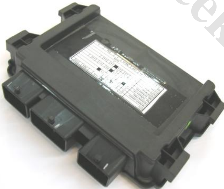
تصویر نود FN