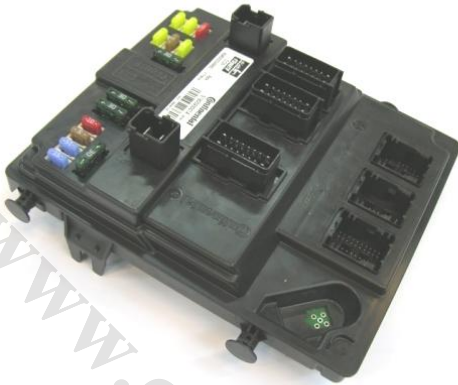
تصویر نود CCN