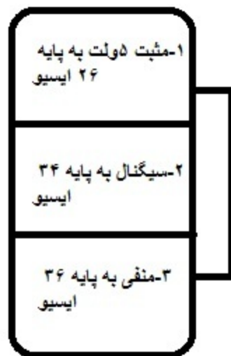
پین اوت سوکت سنسور دریچه گاز