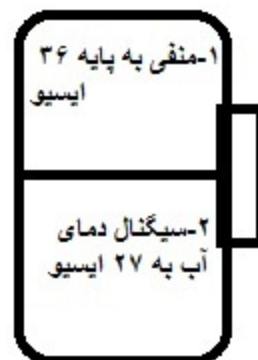
پین اوت سنسور دمای آب