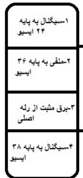
پین اوت سنسور مقدار MAFS هوای ورودی