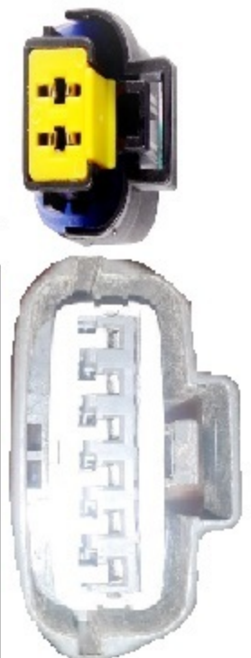
پین اوت سوکت دلکو